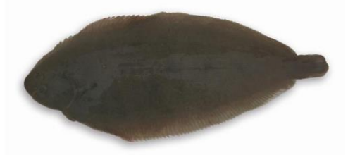
Tong: minimummaat 30 cm