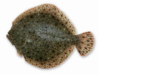
Tarbot: minimummaat 35 cm, max. 1/dag