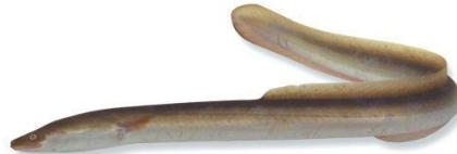
Aal/paling: algeheel meeneemverbod