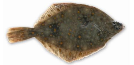
Schol: minimummaat 36 cm