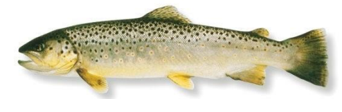
Bruine forel: minimummaat 30 cm