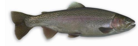
Regenboogforel: minimummaat 30 cm max. 4 forellen per dag