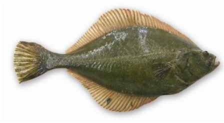
Bot: minimummaat 30 cm